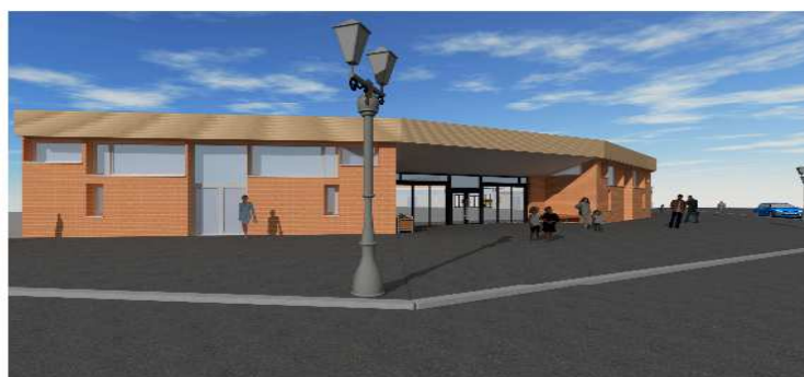
Perspective entrée 3 marché couvert (pour partie) - état projeté