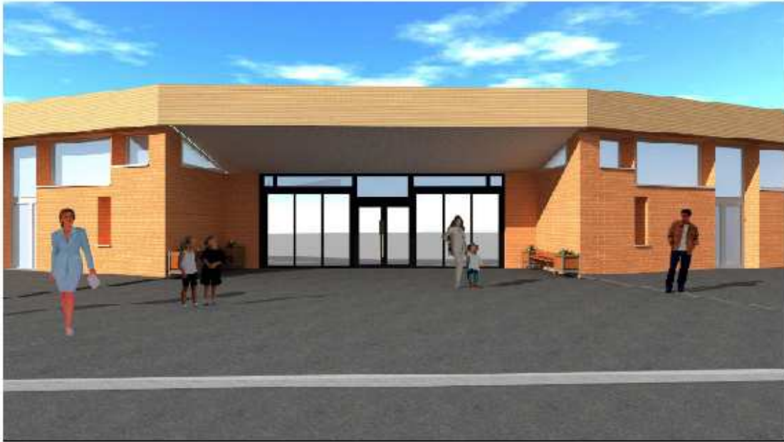
Perspective sur entrée principale 3 - état projeté