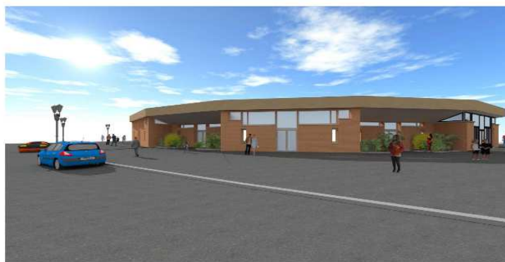
Perspective d'ensemble - état projeté