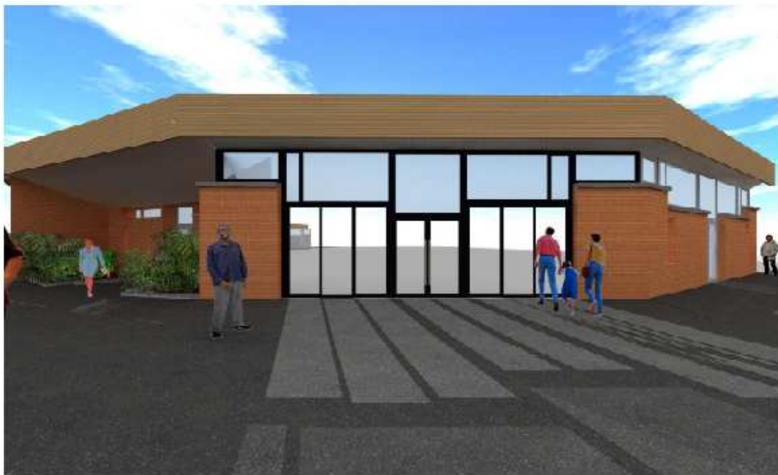
Perspective entrée 13 - état projeté